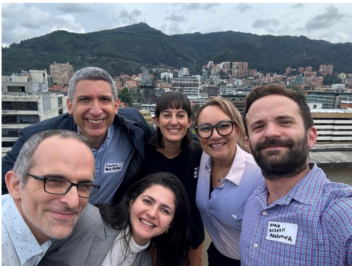
Alianza Latinoamericana de Acción sobre Alcohol (ALASA), Colombia 2024.

Estos esfuerzos fortalecen el posicionamiento de la organización y fomentan alianzas duraderas para una Costa Rica más saludable.